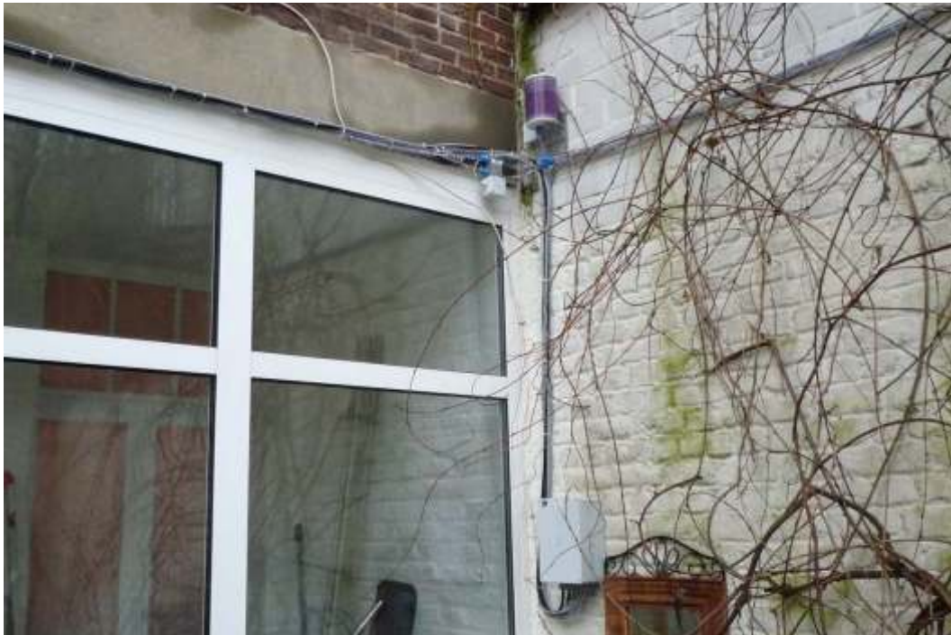
Point de nivellement électro-hydraulique installé sur un mur externe